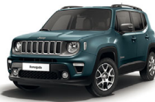
435 Niebieski Shade (metalizowany)