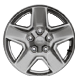
Aluminiowe obręcze kół 17" TECH SILVER