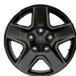
Aluminiowe obręcze kół 17" lakierowane na czarno