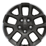
Aluminiowe obręcze kół 18" GRANITE CRYSTAL