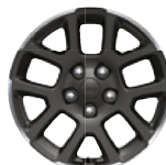
Aluminiowe obręcze kół 18" GRANITE CRYSTAL